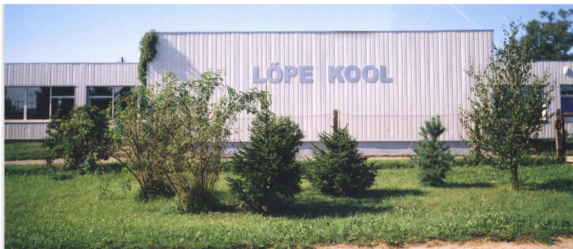
Pilt 1- Lõpe Põhikool, kus toimub kooliõpilaste igapäevane töö.

Täname Lõpe Põhikooli õpilasi ja õpetajaid, kes olid abiks meie uurimistöö valmimisele.