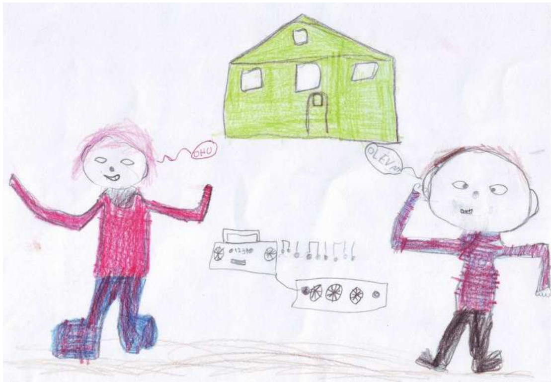
Pilt 3- joonistanud Kevin Kester 1. klass