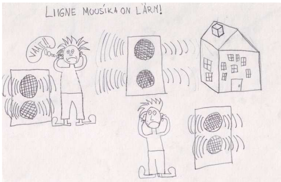
Pilt 4- joonistanud Kaur Eermaa 4. klass