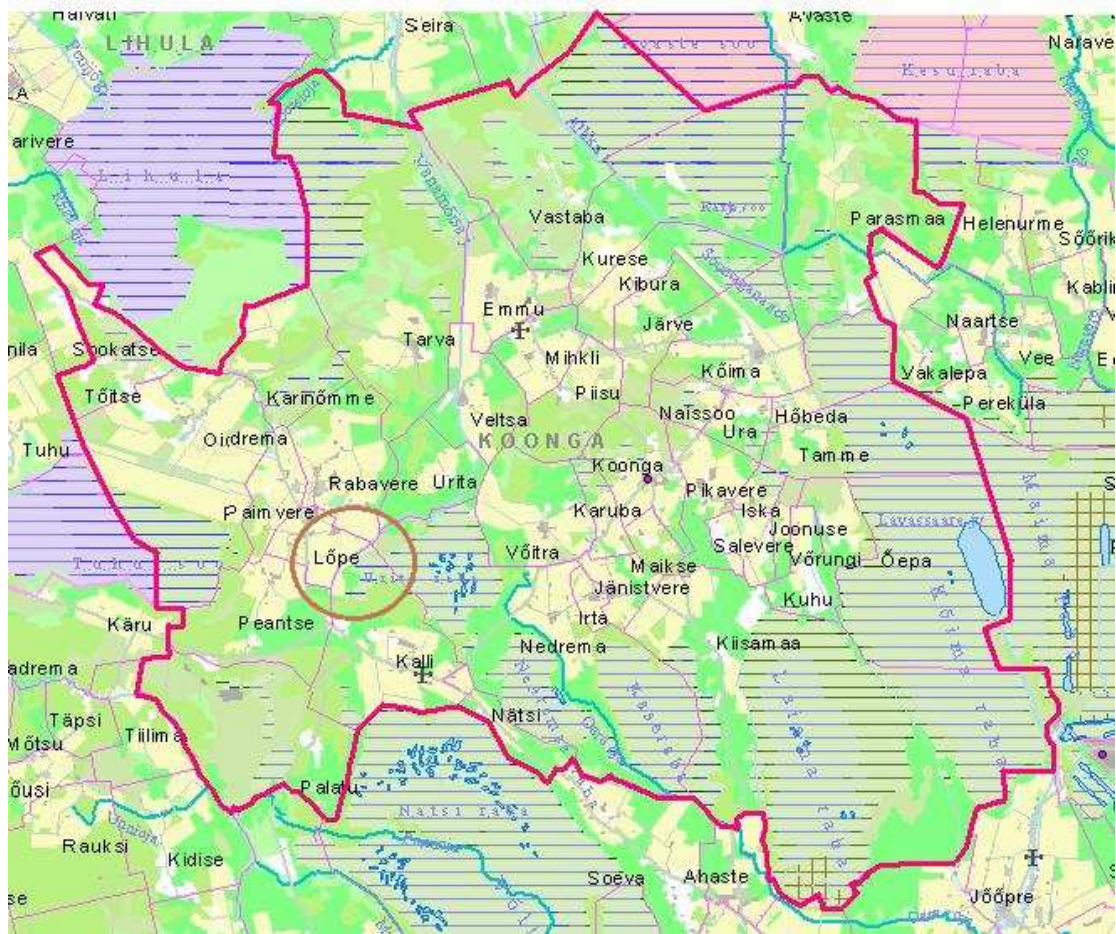
Pilt 2- Lõpe küla Koonga vallas Pärnumaal